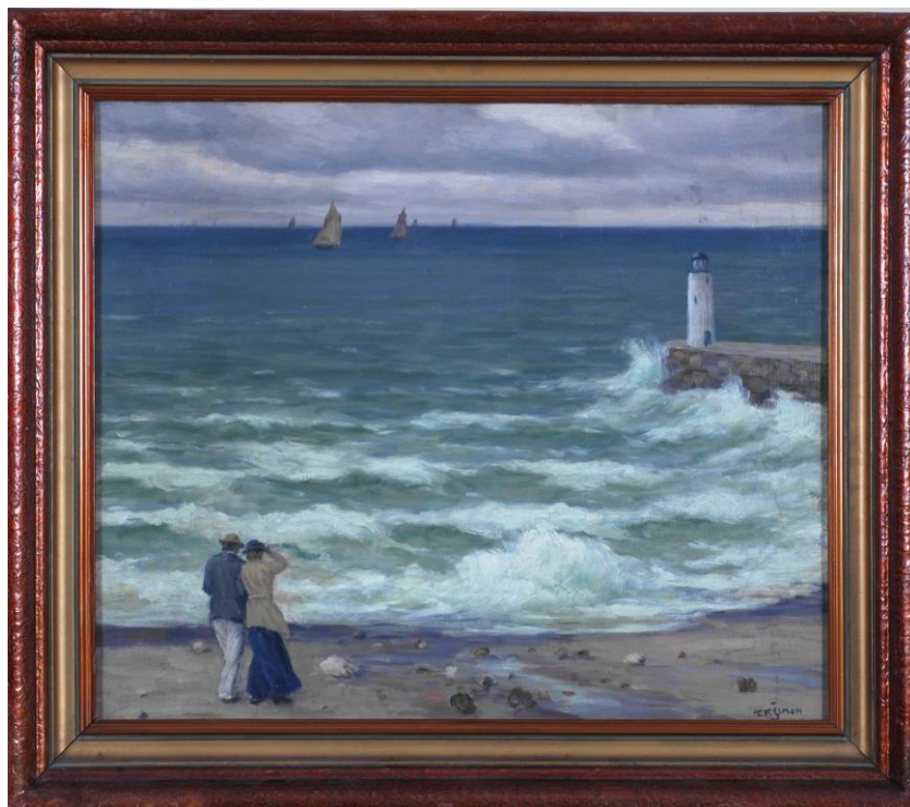
František Tavík Šimon, Onival (U moře) , 1902