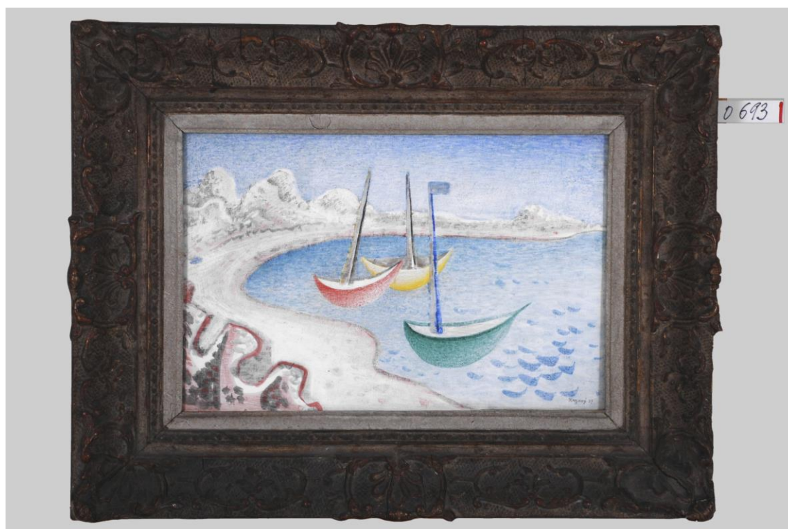
Jan Zrzavý, Záliv , 1937